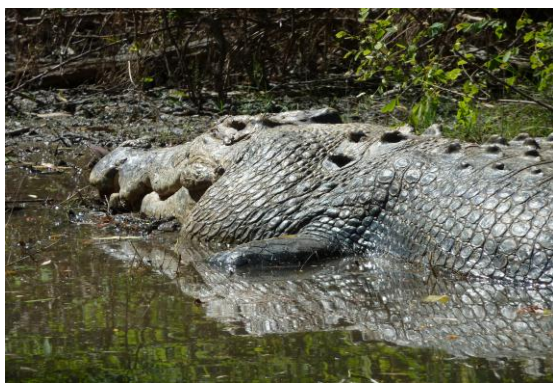
<巨大なクロコダイル>

ダーウィンから車で1時間のところにあるアデレード川周辺の観光です。フォグ・ダム自然保護区では、水辺に集うカササビガンなどの野鳥を観察します。その後、餌に暗い付いて飛び上がるイリエワニが間近で観られるジャンピング・クロコダイル・クルーズにご参加いただきます。最後にウィンドオブウェットランドの展望台で広大なマカライ平原の眺望をお楽しみいただいた後、ダーウィンへ戻ります。