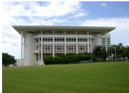
<ノーザンテリトリー準州議事堂>