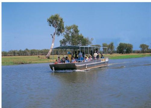
<イエローウォータークルーズ>

最後に、カカドゥ地域に住むアボリジニの人々が、自分達の文化風習を知ってもらうことを目的として設立された「ワラジャン・アボリジナル・カルチュラルセンター」を訪れ、ビニンジ（カカドゥの伝統的所有者であるアボリジニ）の文化や歴史に触れていただきます。