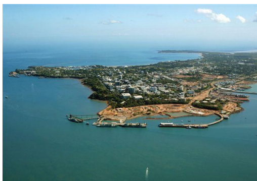
<上空から見たダーウィン市内>

ツアー内容：熱帯の国際近代都市・ダーウィンの市内主要箇所を巡るツアーです。中国人の移民が建設した中華寺院や第2次世界大戦で大打撃を受けたストークヒル埠頭や、イースト・ポイント旧軍事基地跡と植物園を車窓より観光します。このツアーでは、ノーザンテリトリー美術博物館も見学します。